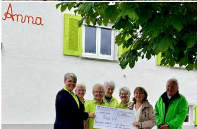
Spende der Bergmiezengänge dieses Jahr an den Verein Anna e. V. für krebskranke Kinder