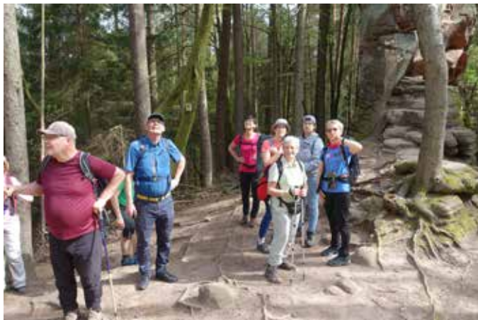
Dahner Felsenland 2024