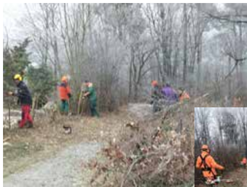
Neue Benjes Hecke Mittel-/Südteil (D. Weinmann)

Die Ehrenamtlichen der OG waren wie in den vergangenen Jahren wieder fleißig bei der Pflege und dem Erhalt des flächenhaften Naturdenkmals. Es wurden vier Pflegeeinsätze durchgeführt. Im Januar wurde ein Heckenteil auf ca. 30 m, zwischen Mittel- und Südteil Auf-den-Stock-gesetzt. Im Anschluss wurde wieder eine Benjes Hecke aufgebaut.