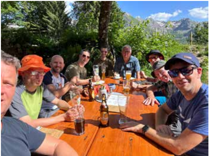
Hindelanger Klettersteig 2023