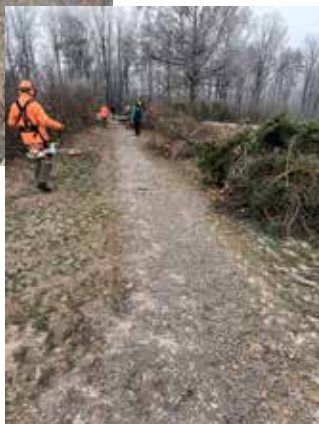
Gehölze aus dem Heckenrückschritt (D. Weinmann)