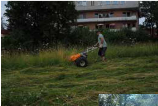
Sommermahd J.Trimborn mit Balkenmäher (D.Weinmann)

Die Sommermahd Ende Juli, sowie die beiden Pflegeeinsätze im September und Oktober zur Weidenachpflege, ergänzten das Pflegejahr 2024. Danke an alle Helferinnen und Helfer!