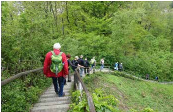
Wanderung rund um Weilimdorf