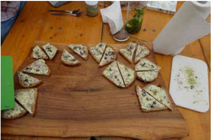
Kräuterwanderung mit Birgit Jakobs