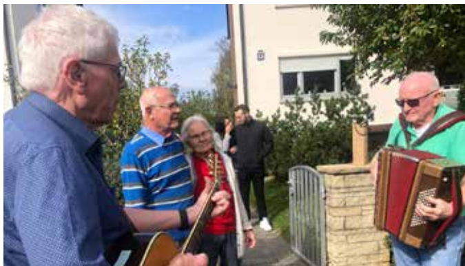
Singgruppe beim Geburtstagsständchen