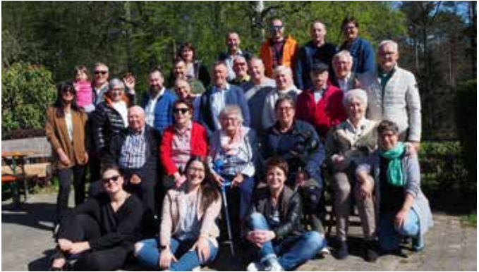
AKNU-Truppe beim Jubiläumsfest