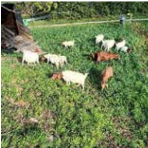
Burengeißen mit Zicklein

Der Landschaftserhaltungsverband bestätigte bei der Begehung am 4. November 2024 die vorbildliche Durchführung der einzelnen Pflegemaßnahmen durch die OG Bonlanden und die extensive Beweidung durch die Kamerunschafe und Burenziegen von Landwirt und Tierhalter Daniel Vogel. Der Weideauftrieb mit sechs Burengeißen und sieben Zicklein begann bereits am 16. April. Die Schafböcke folgten am 20. April und für die acht Kamerunauen mit den 13 Lämmern begann die Weidesaison auf dem Haberschlai am 29. April. Insgesamt waren es 38 Tiere zu Beginn der Weidesaison. Die insgesamt knapp 4 ha große Fläche wurde mit 32 wechselnden Koppelweiden, bei zwei und teilweise drei Weidegängen, zuverlässig von den Tieren „bearbeitet“. Für das Freischneiden der Zauntrassen, den Auf- und Abbau von ca. 6 km Weidezaun und das Versetzen der mobilen Weideunterstände sind rund 160 Stunden angefallen. Herzlichen Dank an die Verantwortlichen und Beteiligten.