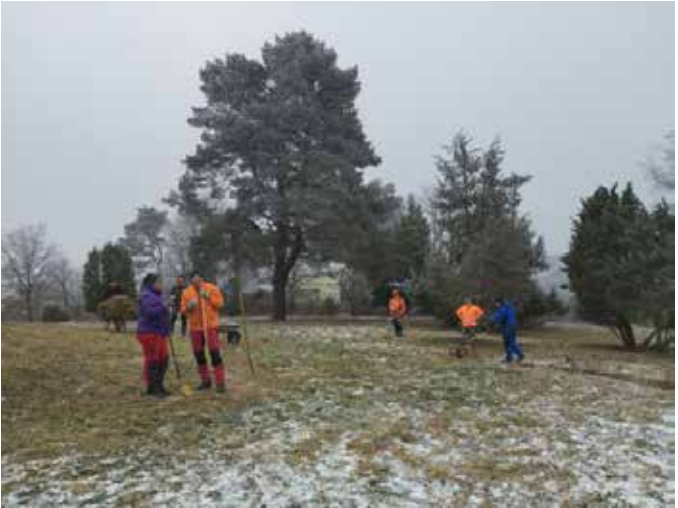
Winterweidpflege im Mittelteil (D.Weinmann)

Parallel zum Heckenrückschnitt erfolgte im Januar bei eisigen Temperaturen auf einer Teilfläche des Mittelabschnitts die Winterweidpflege. Das nach der letzten Beweidung vom Herbst des Vorjahres stehen gebliebene Altgras, Distel, Brombeer, etc. werden mit dem Balkenmäher und Freischneider gemäht, auf Schubkarren aufgeladen und aus der Fläche entfernt.