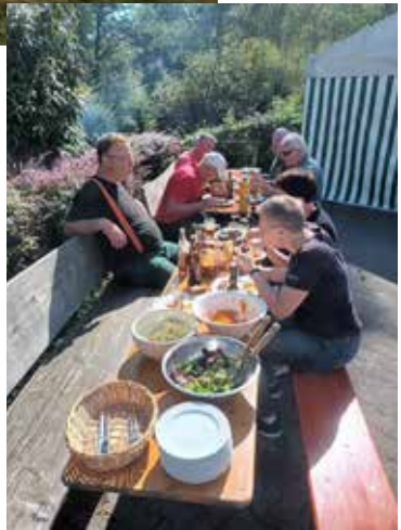
Beim Abschlussessen in der Kelter (D.Vogel)