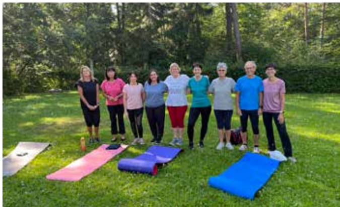
Yoga auf der Wiese an der Kelter