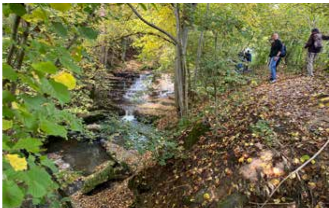
Wanderung zum Ulrichstein Nürtingen