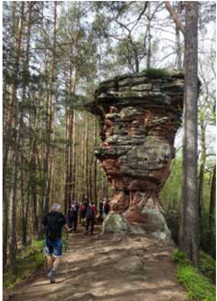
Wanderung 2024 im Dahner Felsenland