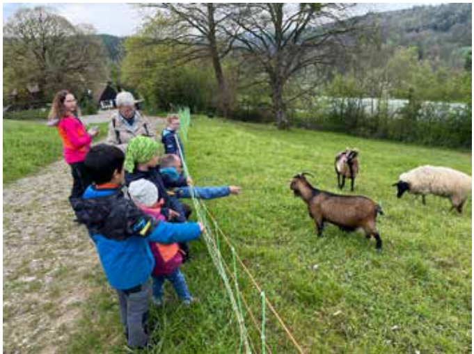
1. Maiwanderung 2024