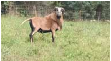
Leo Deckbock Kamerunschafe (D.Vogel)